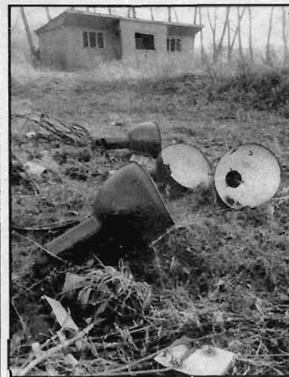
Šatny s vestibulem a osvětlení