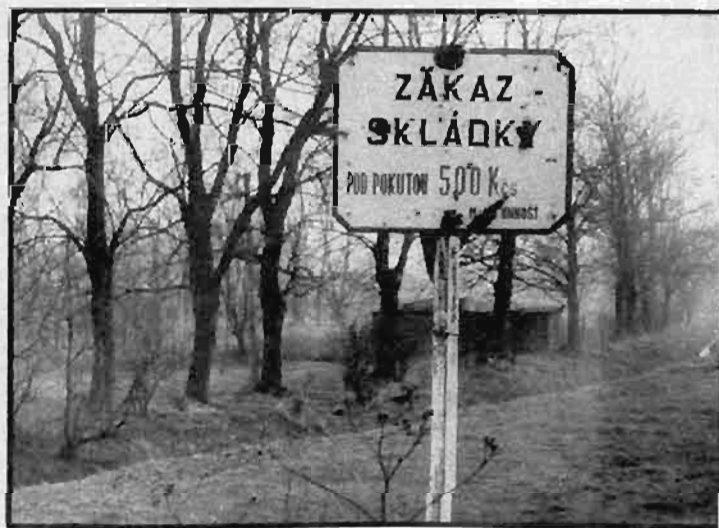
Mezi stromy se před šesti roky ještě hrálo