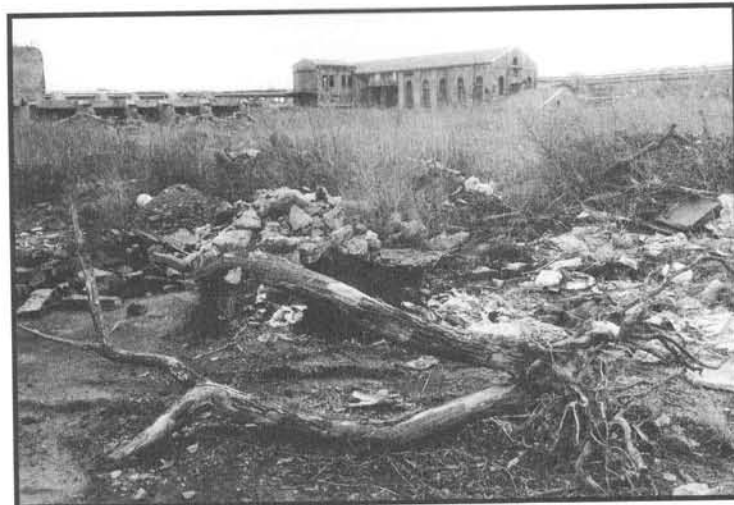
Kladno, středočeský Yucatan, opět zarůstá džunglí (H. Rysová).

Před námi vyvstává chrám boží Trojice nějakého neznámého náboženství. Pálilo se zde vápno do strusek. Železo přecházelo do železnatých silikátů a bylo odtud vypuzováno vápníkem, takže se konečně dostalo do kovové formy. Lomy pásma Amerik v Českém krasu původně vlastnila Pražská železářská a využívala je pro potřeby kladenských hutí. Zem se otevírá a pod námi