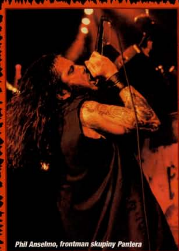
Phil Anselmo, frontman skupiny Pantera